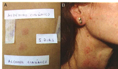
瑞爾氏黑變病多由香水化妝品所引發而成。

1) 瑞爾氏黑變病(Riehl's Melanosis)。本病最早見於1917年由瑞爾報導，因而得名，很可能是焦油的衍生物(例如香水、化妝品等)，而同時經日光照射後引起的光感性皮炎。