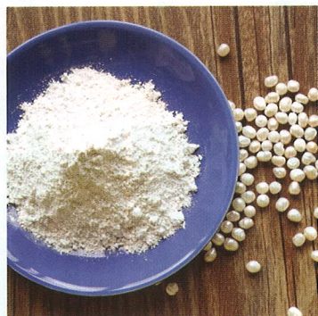
珍珠末對美顏和美的成效出眾。

現代藥學研究顯示，珍珠粉含有廿多種微量元素和角蛋白肽類(皮膚的組成物質之一)等多種成分，能降低皮膚脂質的氧化作用，因此有護膚養顏的作用。除了美白外，珍珠還具有鎮心安神的作用，能改善煩躁、焦慮、失眠、記憶力衰退等情況。